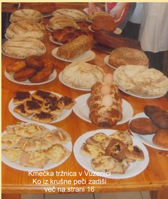
Kmečka tržnica v Vuzenici Ko iz krušne peči zadiši več na strani 16