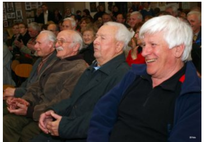
Brez pripravljenosti ljudi za sodelovanje bi razstave ne bilo