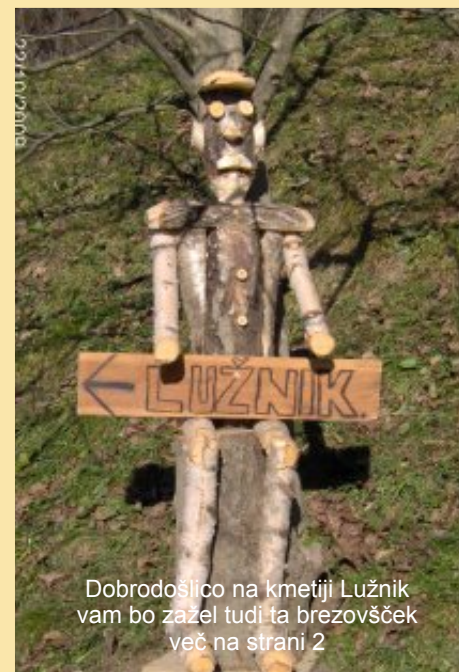
Dobrodošlico na kmetiji Lužnik vam bo zažele tudi ta brezovšček več na strani 2