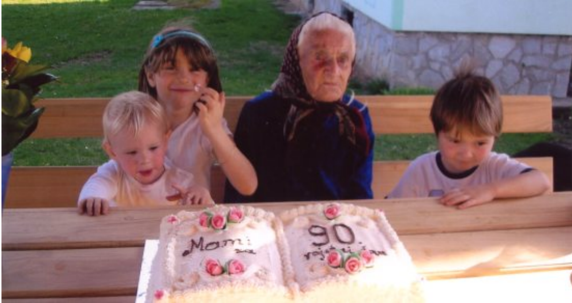
Na sliki ob praznovanju z pravnuki