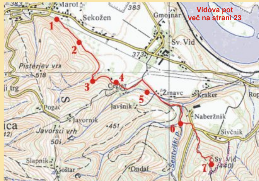
Vidova pot več na strani 23