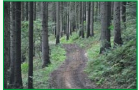
2. Začetni del poti pelje po gozdni vlaki v smrekovem gozdu