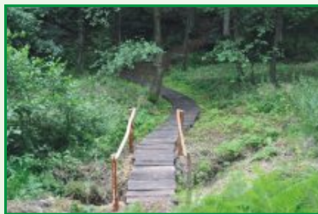
3. Urejena pot čez močvirnata tla

V zgodovini je bil v lasti številnih gospodarjev. Pod imenom SEKOŽEN se kot posest admontskega samostana omenja že leta 1187. Ime Sekožen po ljudskem izročilu izhaja iz nekoč bujnih gozdov, ki pa so jih izsekali. Iz nekdanj malega zaselka je danes zraslo lepo in živahno naselje družinskih hiš, po obronkih pa so med gozdovi posejane številne samostojne kmetije.