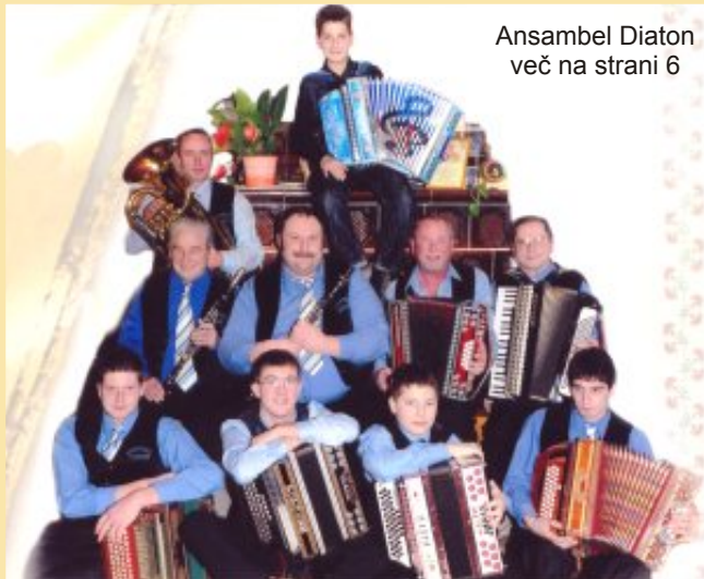
Ansambel Diaton več na strani 6