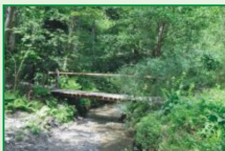
6. Brv čez Šentviški potok