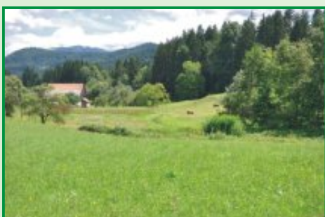
5. Kotanje nekdanjih grajskih ribnikov