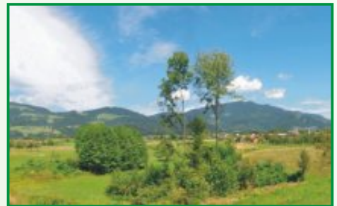
4. Med potjo se odpira pogled na Kozjak od Pernic do Remšnika