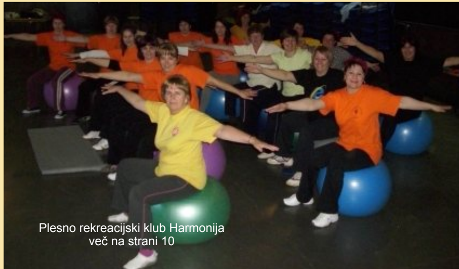
Plesno rekreacijski klub Harmonija več na strani 10