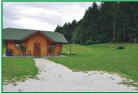
1. Začetek poti pri turistični hišici

... predstavlja nadaljevanje vuzeniške gozdne poti "Pistrov grad" in je skoraj v celoti speljana po gozdu. Skozi krošnje košatih dreves veje prijetno hladen vetrič, v objemu narave se lahko sprostimo, razgibamo, nadihamo svežih moči. Pot je dolga približno 3 km, vodi nas od turistične hišice ob igrišču vse do cerkvice Sv. Vida, ki stoji na osamljeni legi na vrhu hriba.